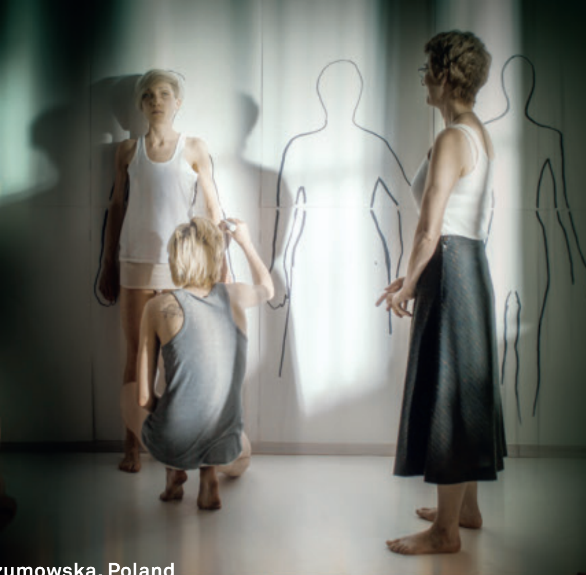
Malgorzata Szumowska, Poland