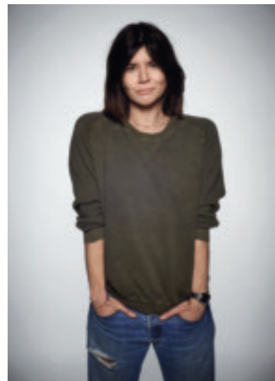
Shooting Star: Malgorzata Szumowska